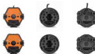
elero Kopf elero head

The motion drives (including Plug&Play version /D+) from elero are available both as a radio version and as a wired version with three different drive heads with revolutions of 6 Nm to 25 Nm 1 .